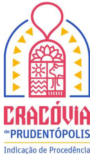
Figura 02 - Representação gráfica da IG a ser aplicada para os padrões de comercialização da Cracóvia.